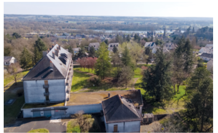
Un projet d'aménagement de 1,2 hectare qui s'étendra jusqu'en 2026 environ.